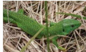
Lézard vert, espèce d'affinité méditerranéenne

Le site accueille une soixantaine d'espèces d'oiseaux, dont la Pie-Grièche écorcheur et la Bondrée apivore.