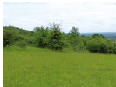
Pelouse mésophile et fruticée