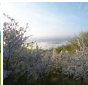
Prunelliers en fleur

Les habitats calcaires, principalement les pelouses, accueillent une faune et une flore spécifiques adaptées. Les conditions d'exposition au sud permettent même la présence d'espèces d'affinité méditerranéenne.