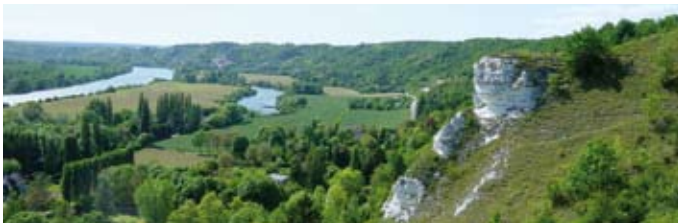
Vallée de la Seine

Les falaises de craies à silex, surtout connues en Normandie, sont excep-