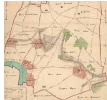
Détail du plan d'intendance de Sagy, 1780 © AD 95 - C105/28

l'urbanisation. Les carrières (41 en tout dont 13 à Saillancourt et 12 à Chardronville en 1846), dont le nombre décroît cependant progressivement, et les cultivateurs sont les plus nombreux. Les commerçants ne seront guère présents avant le début du XX ème siècle. Sagy, avec son église du XVIII ème et l'ancienne mairie à la convergence du réseau de voies et du système parcellaire, est le « chef-lieu » mais n'apparaît pas comme une centralité forte.