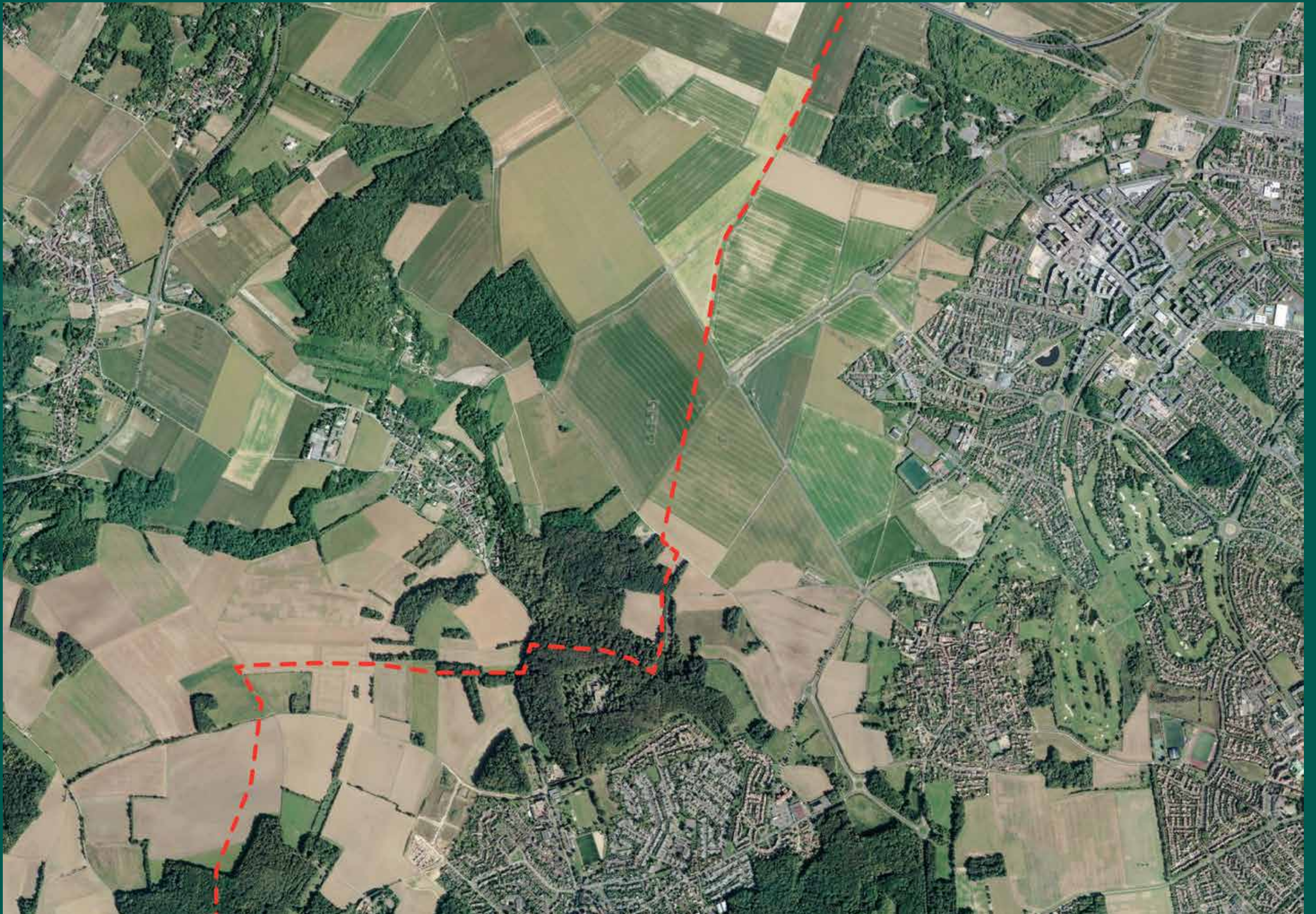
Photo aérienne actuelle montrant l'urbanisation limitée de Sagy et ses hameaux à l'Ouest et l'agglomération de Cergy englobant notamment les anciens villages de Courdimanche et Menucourt à l'Est