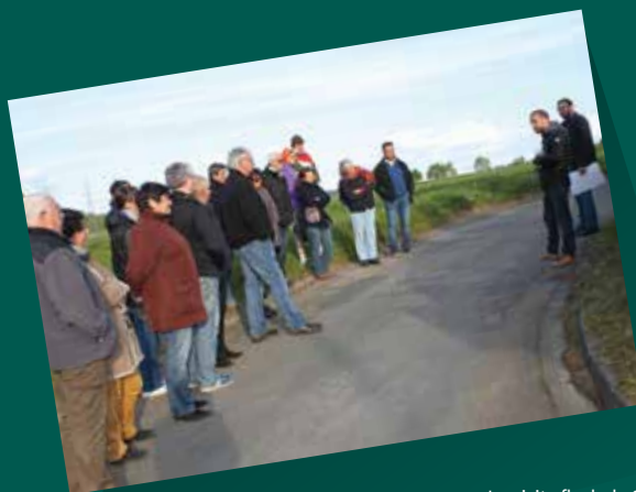
La visite flash de Sagy

A ccompagnées par le Parc naturel régional du Vexin français, les communes de Chars, Neuilly-en-Vexin, Sagy, Santeuil et Us ont choisi d'élaborer conjointement leur Plan Local d'Urbanisme et, dans ce cadre, de porter une attention particulière à leur patrimoine. Pour sensibiliser habitants et élus aux enjeux de développement territorial et de qualité de vie portés par les patrimoines locaux, le Parc, via son label Pays d'art et d'histoire, a organisé dans chaque commune une visite flash. Flash car rapide dans le but d'être attrayante (moins d'une heure de visite) ; flash car ciblée sur une thématique spécifique démontrant le lien entre patrimoine et urbanisme, passé et futur, histoire et projets ; flash car informelle et donc propice aux échanges entre les participants et les intervenants du Parc..