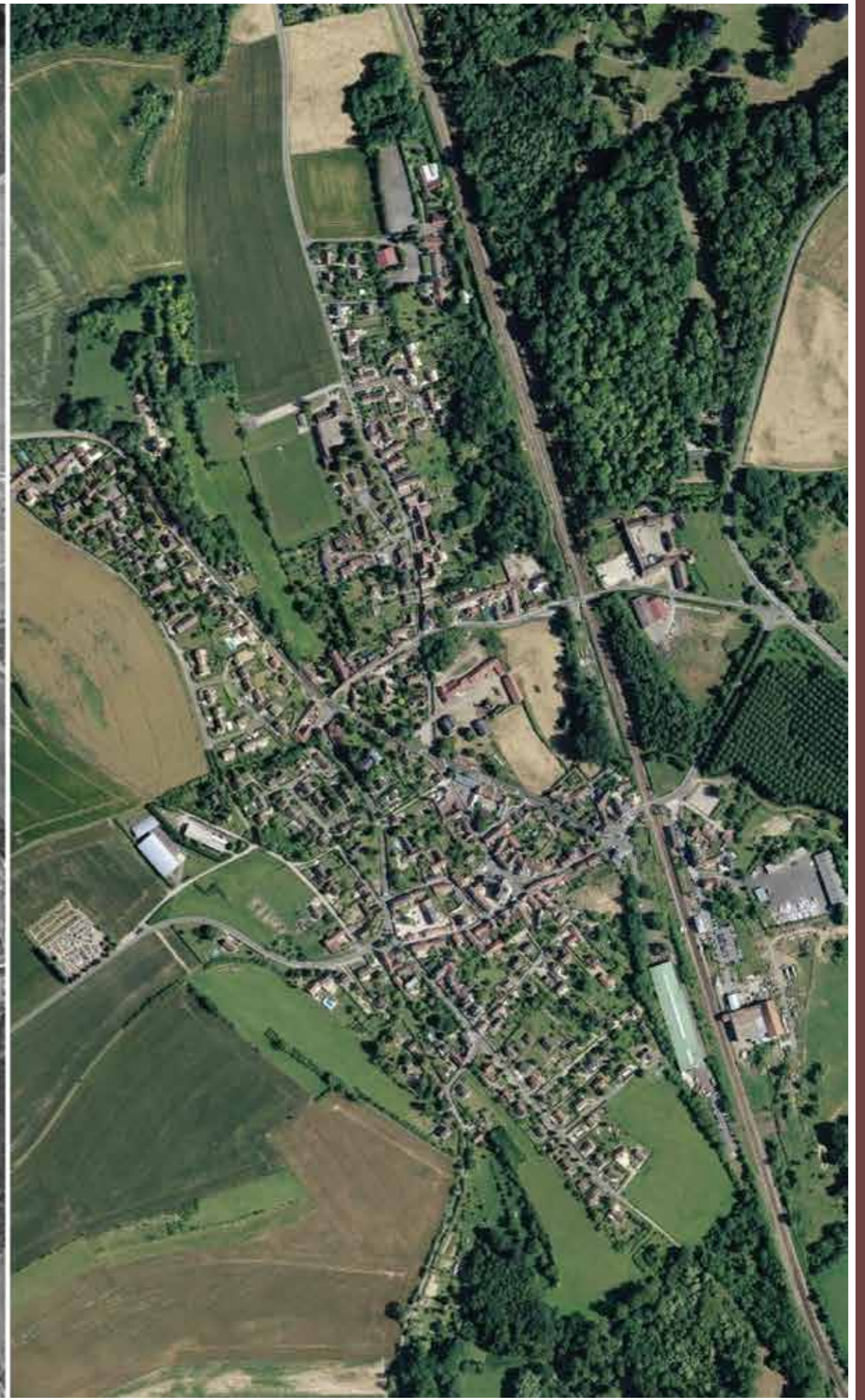
Evolution urbaine d'Us : carte d'Etat-Major des années 1830, photo aérienne des années 1950 et photo aérienne actuelle