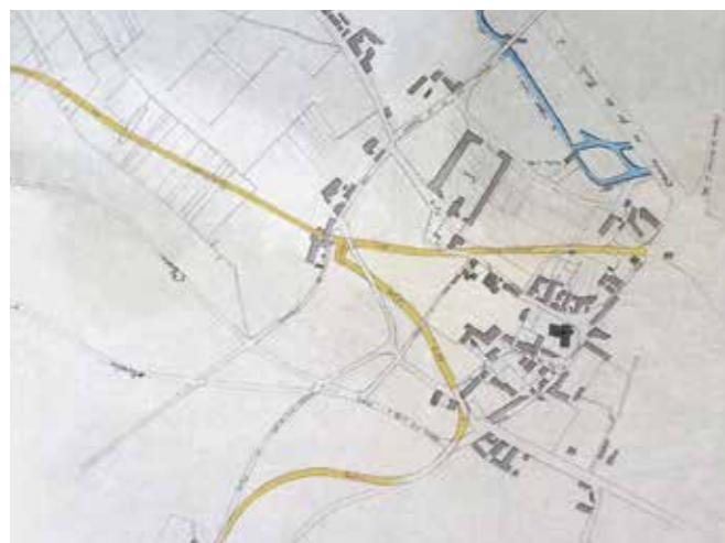
Plan d'alignement des percements des deux nouvelles rues, fin du XIX ème siècle © AD 95, 05259 : Administration communale.

de l'ensemble gare-sucrierie a eu pour effet de contraindre l'urbanisation de la commune vers l'Ouest, précisément le long des deux voies créées à la fin du XIX ème siècle. La rue de la Libération joue en particulier le rôle d'axe majeur communal. Elle a d'ailleurs été parée d'un véritable programme édilitaire avec la construction de la mairie-école en 1889, d'un lavoir sur la Viosne en fond de parcelle ainsi qu'un bureau de Postes, Télégraphes et Téléphones en 1897. Utilitaire, cette rue a aussi une fonction paysagère. Elle guide, de fait, le regard du promeneur ou de l'usager et ménage des points de vue sur la place du Commerce et la mairie-école ainsi que sur l'église et l'ancienne Grand Rue (actuelle rue Henri Clément) où se concentraient autrefois les commerces.