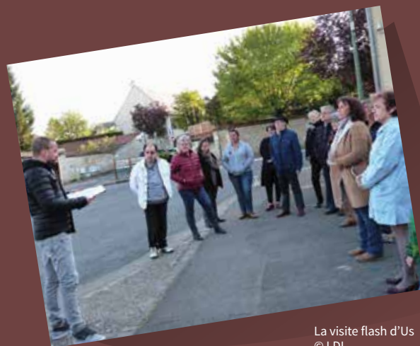
La visite flash d'Us

A ccompagnées par le Parc naturel régional du Vexin français, les communes de Chars, Neuilly-en-Vexin, Sagy, Santeuil et Us ont choisi d'élaborer conjointement leur Plan Local d'Urbanisme et, dans ce cadre, de porter une attention particulière à leur patrimoine. Pour sensibiliser habitants et élus aux enjeux de développement territorial et de qualité de vie portés par les patrimoines locaux, le Parc, via son label Pays d'art et d'histoire, a organisé dans chaque commune une visite flash. Flash car rapide dans le but d'être attrayante (moins d'une heure de visite) ; flash car ciblée sur une thématique spécifique démontrant le lien entre patrimoine et urbanisme, passé et futur, histoire et projets ; flash car informelle et donc propice aux échanges entre les participants et les intervenants du Parc.