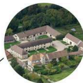
La Bergerie de Villarceaux lieu d'accueil de groupes ouvert depuis 2012