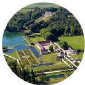
L'association La Source implantée dans le Domaine de Villarceaux en 2002